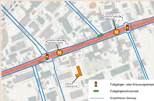
Lageplan Stadtbahn-Haltestellen Linie 2

Die Herforder Straße kann durch Ampelanlagen von den Schülerinnen und Schülern jederzeit sicher überquert werden.